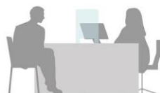
SCHERMO 30X50 H