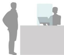
SCHERMO 50X75 H

Questo prodotto permette di essere posizionato su di un desk, un banco da reception, una scrivania in modo provvisorio, per un periodo limitato oppure in modo permanente e di reggersi autonomamente grazie ai suoi piedi in plexiglass, senza la necessità di installazioni attraverso viti, cavi o particolari collanti.