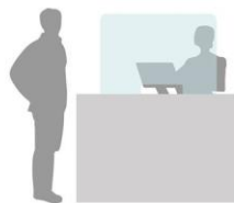
SCHERMO 100X75 H